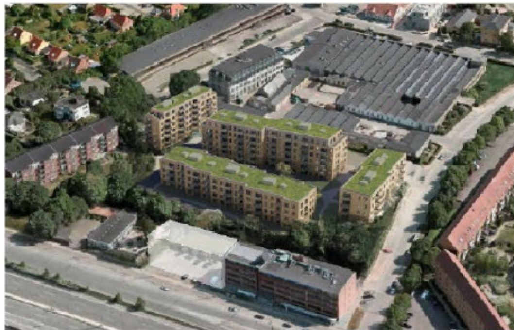
Bebyggelsen set fra syd-vest. Illustration: Praksis Arkitekter.